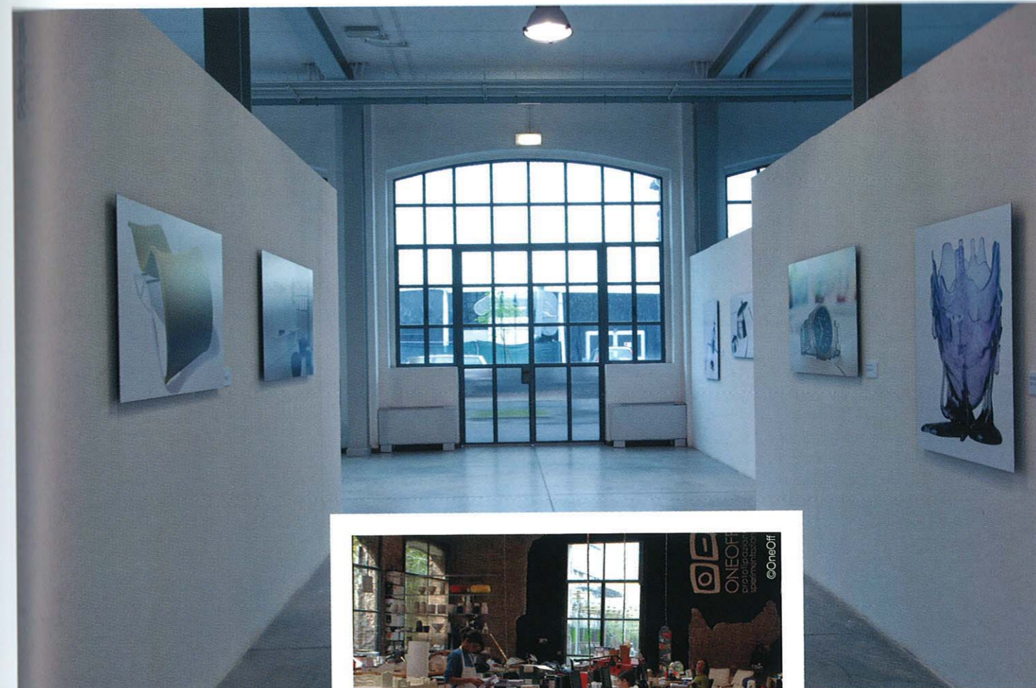
L'espace Polifemo, lieu de rencontres et d'expositions.