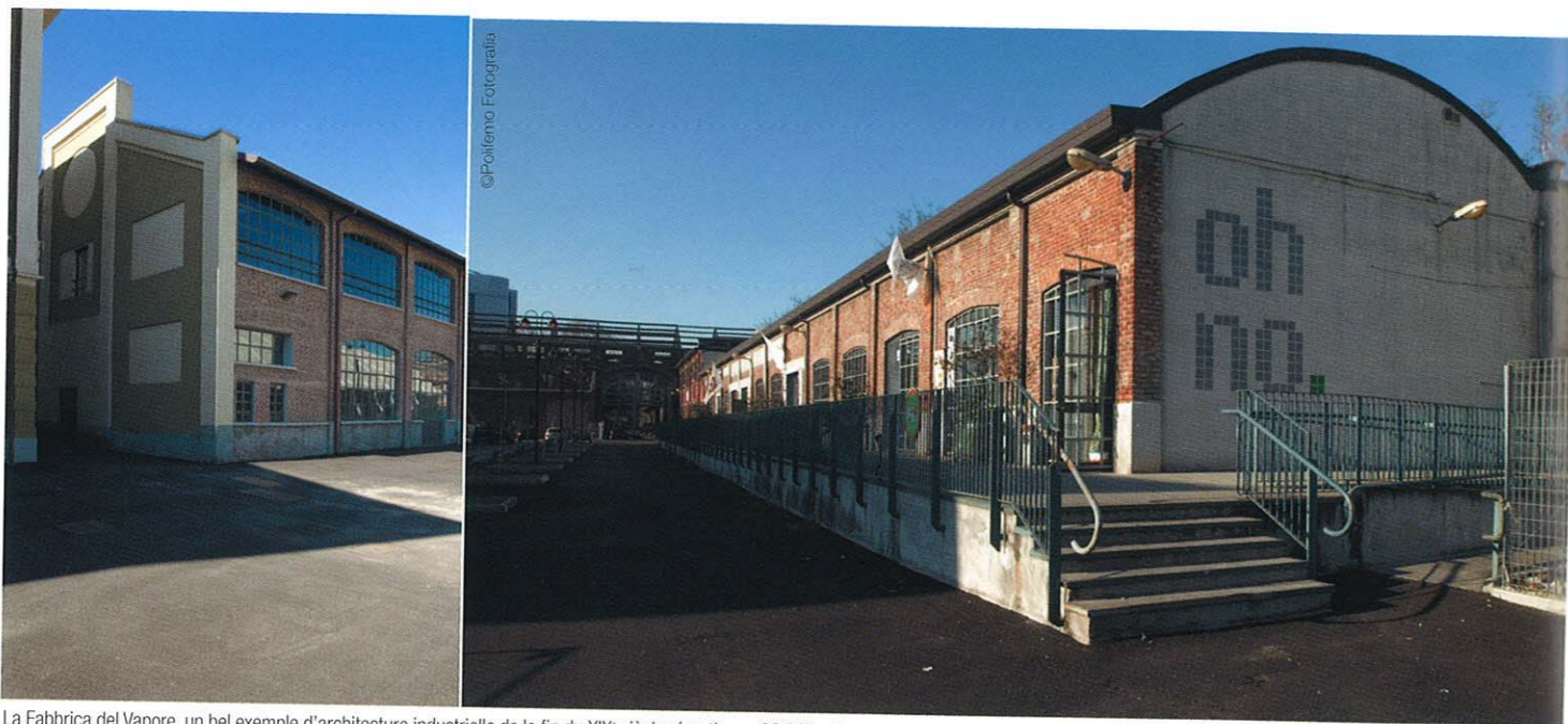
La Fabbrica del Vapore, un bel exemple d'architecture industrielle de la fin du XIX e siècle répartie sur 30 000 m 2 .

La Fabbrica del Vapore à Milan est un bastion de la créativité où art, architecture, design, multimédia, danse et musique entretiennent des liens de cohabitation et d'harmonie. Un territoire culturel défini sur des valeurs de durabilité et de création responsable.