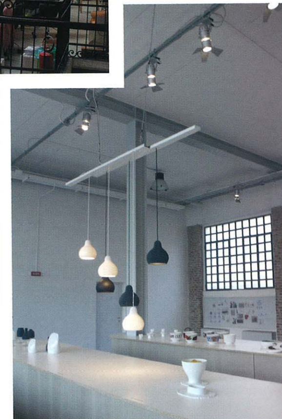
Les luminaires de Guillaume Delvigne dans l'espace Industriel.