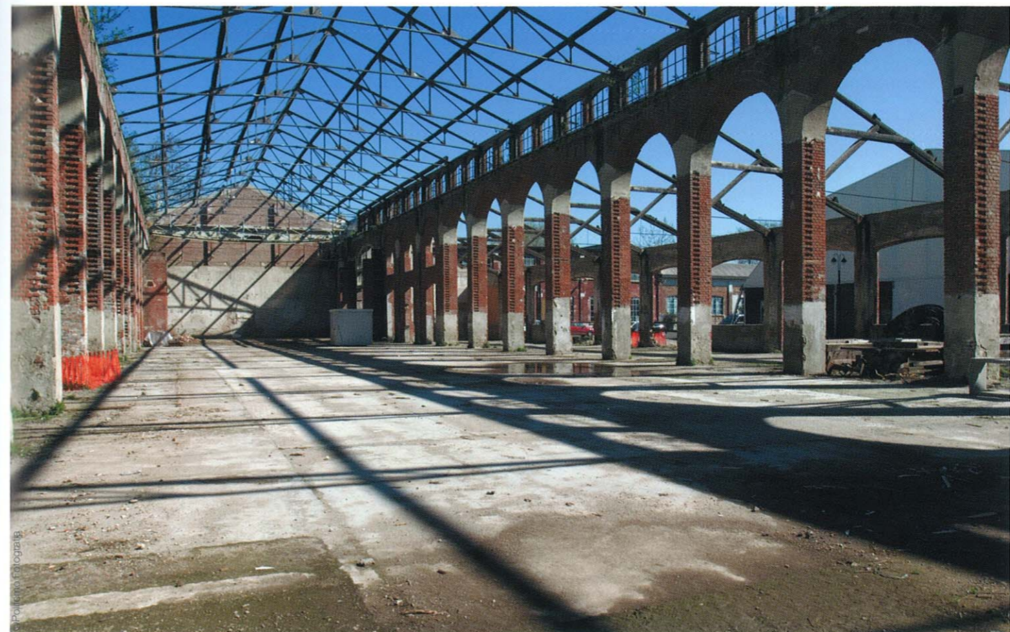
La Fabbrica del Vapore, un processus de reconversion architecturale et fonctionnelle, entamée en 2002 et encore en cours aujourd'hui.