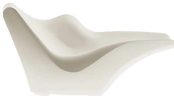
Chaise longue "Tokyo Pop", design Tokujin Yoshioka. Driade, 2003. Elle nécessite beaucoup d'énergie pour sa production et est difficilement biodégradable.