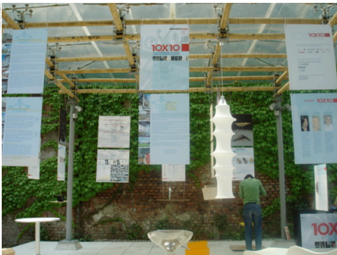
Installation de l'exposition 10X10 à la Fabbrica del Vapore à Milan. Une construction alternative en bambou de l'architecte colombien Mauricio Cardenas.