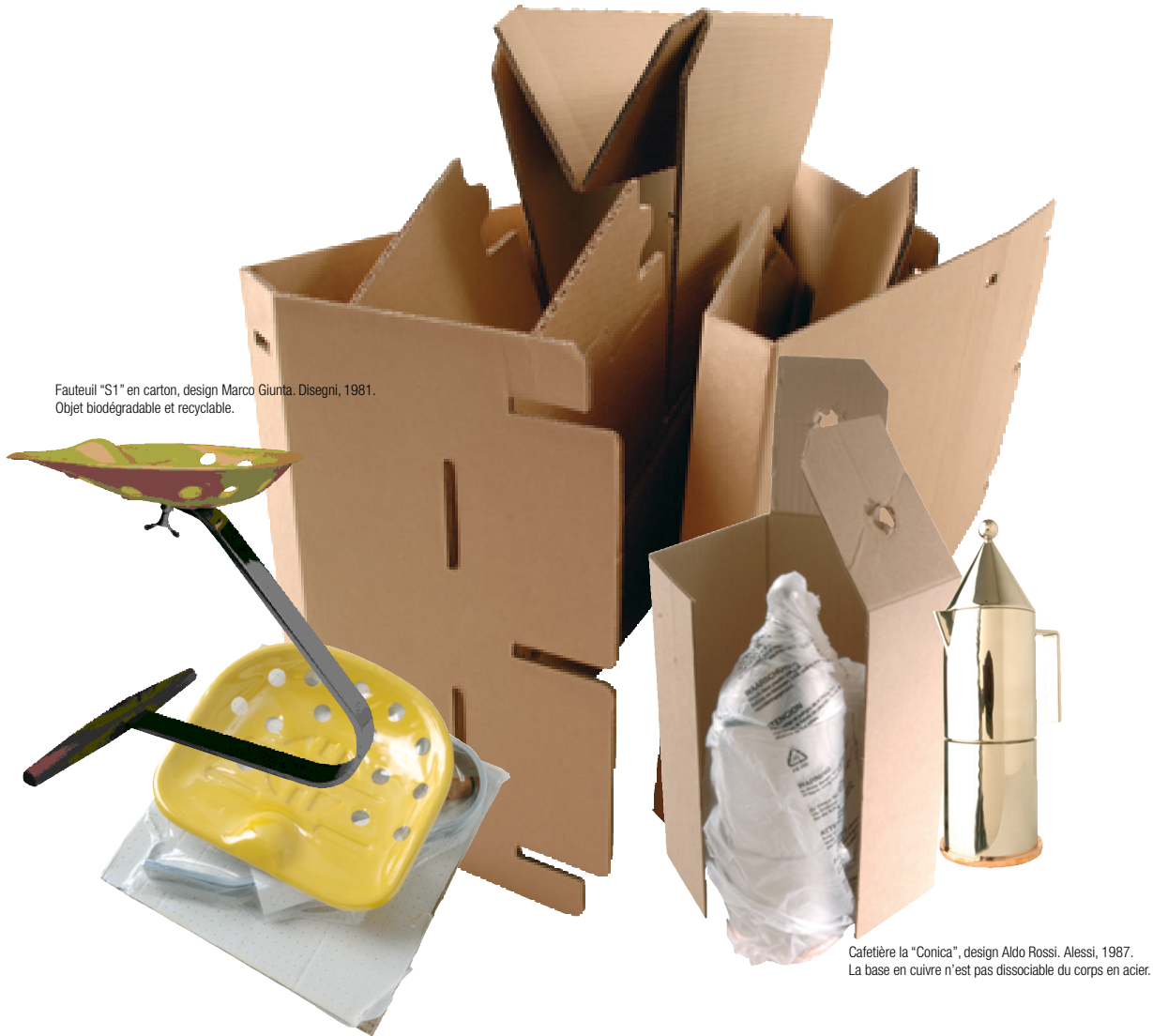
Fauteuil "S1" en carton, design Marco Giunta. Disegni, 1981. Objet biodégradable et recyclable.