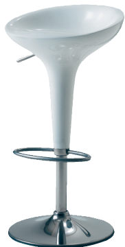
Tabouret "Bombo", design Stefano Giovannoni. Magis, 2002. La dissociation des matériaux le rend plus recyclable